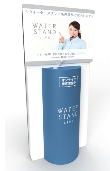
今後導入予定の什器イメージ

複数ヶ所を同時監視しながら、各拠点と遠隔接客(通話)ができ、スタジオや自宅からリモートワークで接客業務を可能にするベストプロジェクトの自社開発サービスです。「えんかくさん」を導入すると、テレショッパー（接客スタッフ）は自宅やスタジオに居ながらにして、店舗にいるお客様に対し遠隔で接客業務を行うことができます。